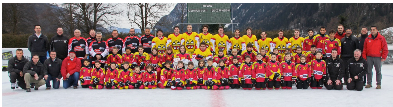
Hockey Club Poschiavo stagione 2014-15